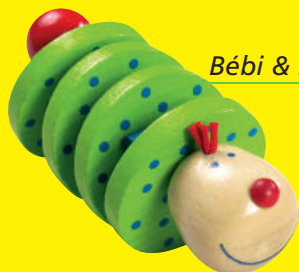
Bébi & kisgyermekjátékok